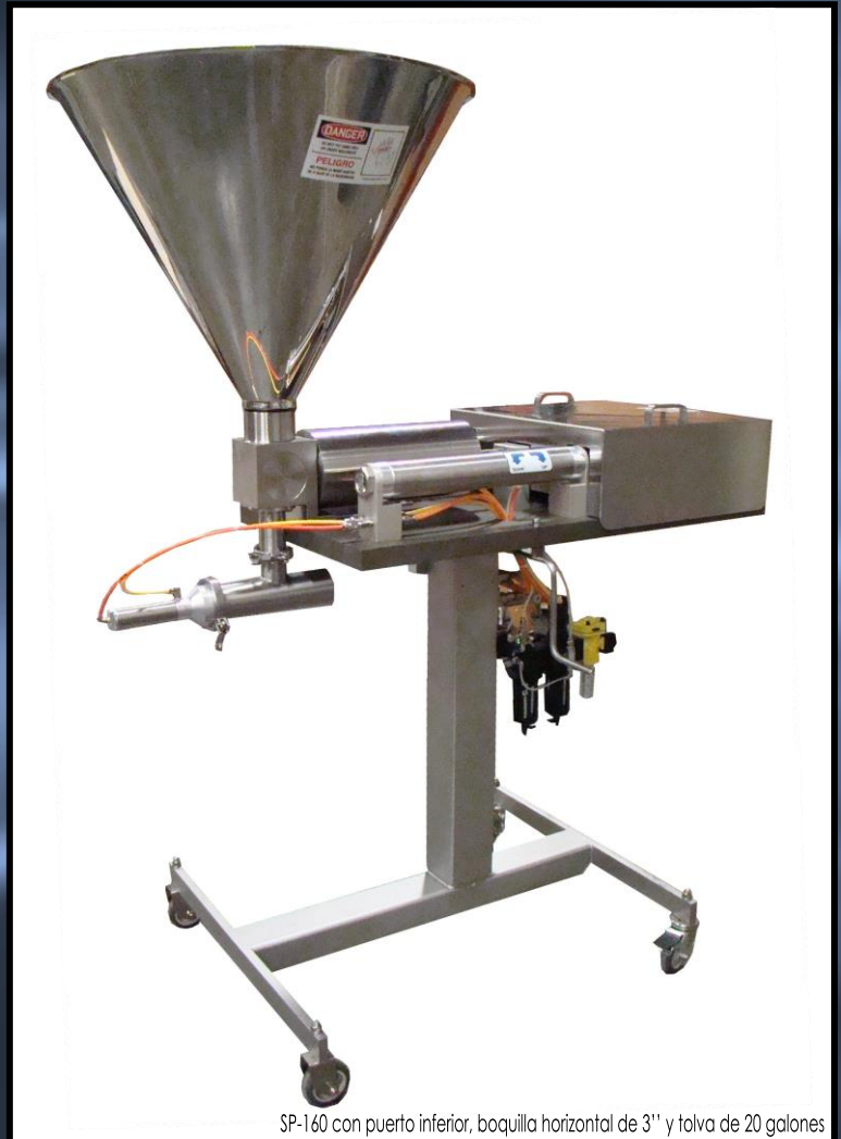
SP-160 con puerto inferior, boquilla horizontal de 3" y tolva de 20 galones