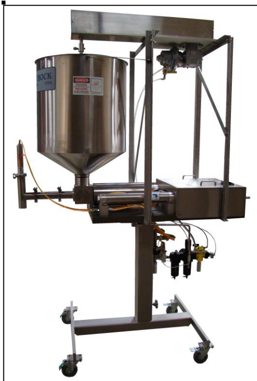
SP-160 con puerto delantero, boquilla de 2" y tolva con agitación