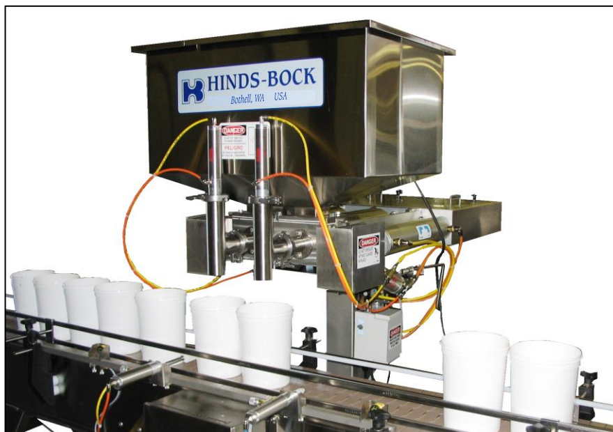
SP-160 con puerto delantero y chorreras verticales de 2" con sistema de expulsión sobre línea de relleno de cubos